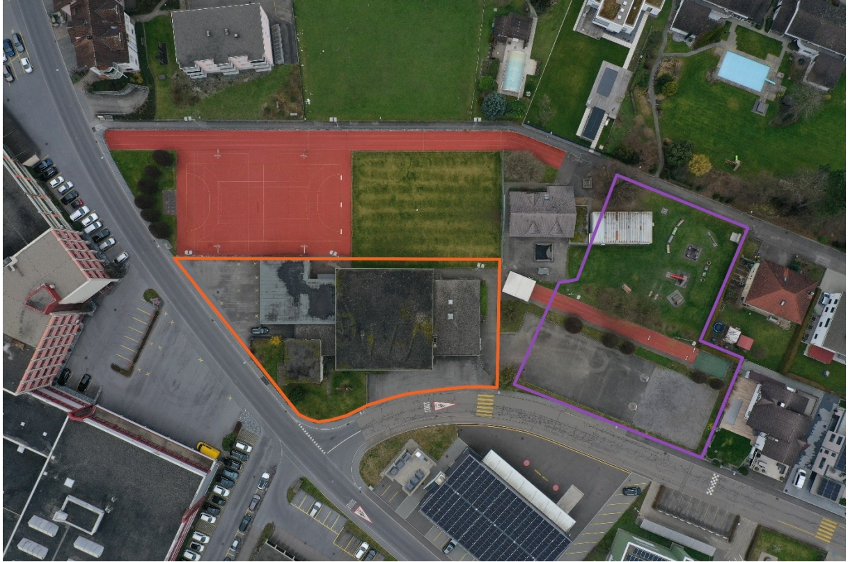
Violett: Projekt 1 Neubau Schulraum Orange: Projekt 2 Schaffung Freizeit Areal