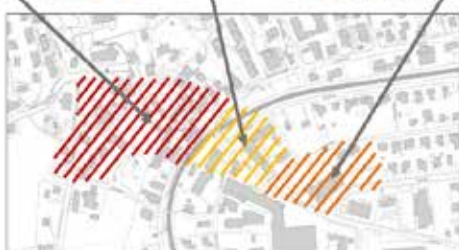
Auszug kommunaler Richtplan, Gemeinde Tuggen (RRB 487/2021)

Das öffentliche Informations- und Mitwirkungsverfahren bezweckt, dass die Tuggner Bevölkerung ihre Ideen, Anliegen und Bedenken zum Entwurf vom Richtplan äussern darf. Diese Möglichkeit hat die Bevölkerung im Winter 2019/2020 erhalten. Danach hat der Gemeinderat in der Sitzung vom 9. Dezember 2020 den Richtplan der Gemeinde Tuggen beschlossen.