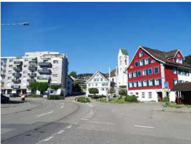
Traditioneller Dorfkern / Zentrum Tuggen heute

Ein gut erhaltener Dorfkern und ein belebtes Zentrum machen eine Gemeinde attraktiv. Der Dorfcharakter und die traditionellen Häuser im Dorfkern machen die Gemeinde Tuggen aus. Der Dorfkern ist gleichzeitig das heutige Zentrum von Tuggen. Das Zentrum hat aber nur wenige Restaurants, Einkaufsmöglichkeiten und Geschäfte. Es gibt zudem fast keine Orte, um sich mit anderen Menschen zu treffen und Zeit zusammen zu verbringen. Auch einen Dorfplatz gibt es nicht. Stattdessen ist der Dorfkern auf den Verkehr ausgerichtet. So wie der Strassenraum heute gestaltet ist, ist das für Anwohner und für Leute, die sich im Zentrum aufhalten möchten, schlecht.