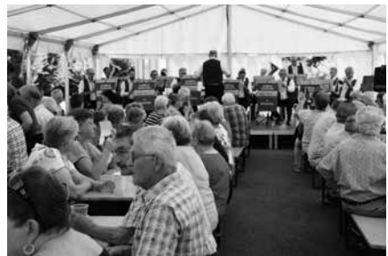
Stimmungsvolle Unterhaltung im Festzelt.