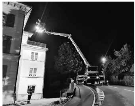
Hubretter der Feuerwehr Schübelbach im Einsatz.

Eine Einsatzübung durften wir mit dem Seerettungsdienst Oberer Zürichsee absolvieren. Auf dem Zürichsee im Bereich Mündung Linth und Bätzimatt wurde erfolgreich der Ernstfall geübt. Hauptschwerpunkte umfassten das Zusammen-